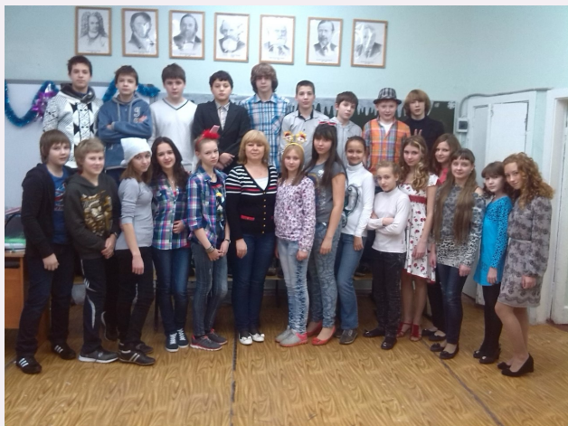
Новогодний огонек в 7Б