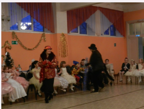
Новогодний утренник в начальной школе