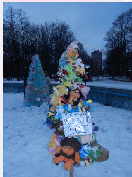
Креативная елка от школы 105 (грамота «За активное участие»)