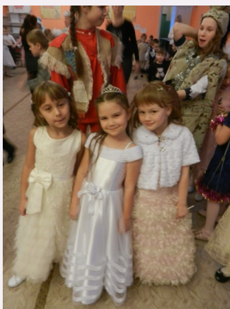
Маленькие принцессы на новогоднем утреннике