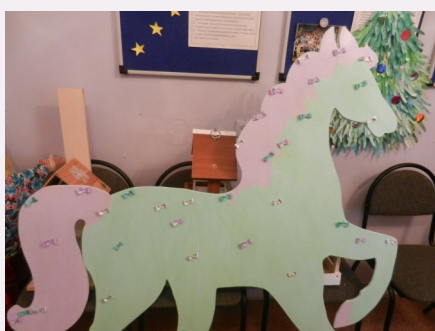
Арт-объект «Ах, вы, кони, мои кони»