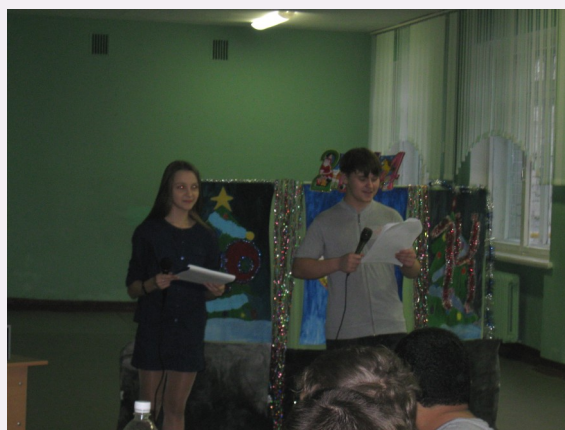
Новогодний огонек в 7 А, 7В