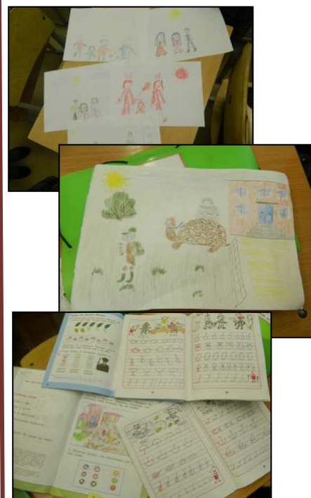
Сорокина Алена, 8 «Б»

Вот и первые рисунки, нарисованные ребятами, и домашние работы, сделанные ими: