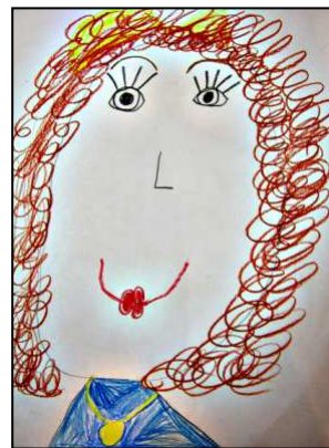
«Марина Евгень- евна». Автор рисунка: Морарь Юлия, 1Б