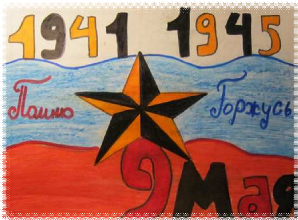
Чебыкин Максим 8Б.