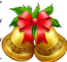
Фото и материал разворота подготовила Екатерина Кочина