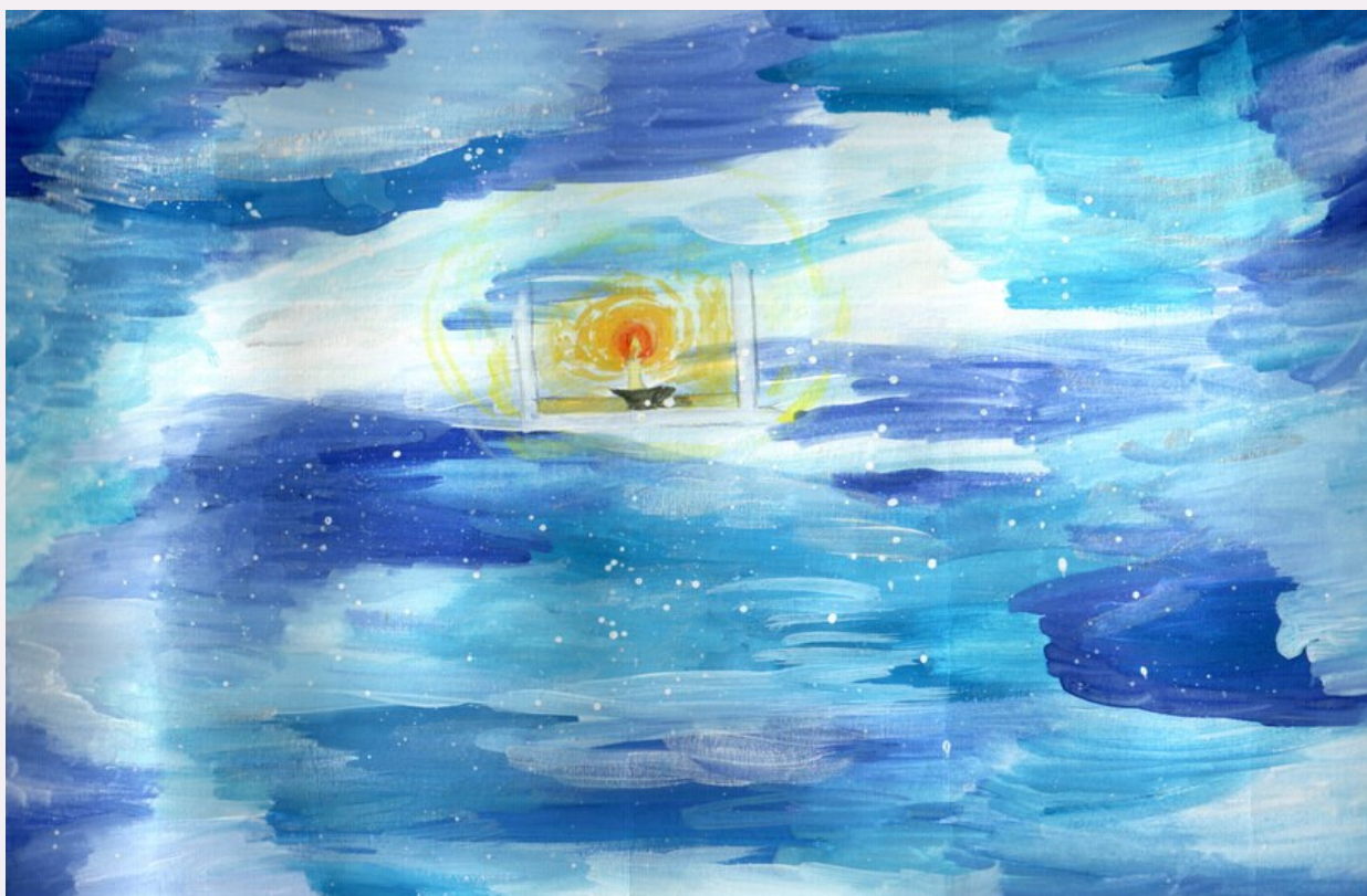
Рисунок Бажановой Светланы, 6Б “Зимняя ночь” (по одноименному стихотворению Б.Пастернака)

Ноябрь. Тяжёлое, свинцовое небо, ледяной ветер, пронизывающий тело до костей, чёрные силуэты деревьев и, кажется, совсем мёртвая земля - всё это нагоняет тоску и непонятную тревогу. Но на самом деле природа просто затаилась в ожидании, в ожидании чего-то светлого. И оно приходит с первым днём настоящей зимы. Снег аккуратно и бережно укутывает этот печальный пейзаж в своё уютное одеяло. И в один миг всё стало прекраснее. Днём снежные хлопья кажутся перьями, летящими с небесной подушки, вечером - звёздным дождём, неожиданно обрушившимся на город. В такие моменты в каждом из нас просыпается ребёнок, способный искренне радоваться и восторгаться таким, казалось бы, простым вещам как красивая снежинка, упавшая на пальто или дерево под окном, которое замело прошлой ночью и оно теперь ну совсем как сказочное. И всё-таки зима - волшебное время года!