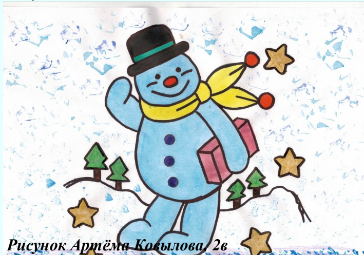
Рисунок Артёма Кобылова, 2в