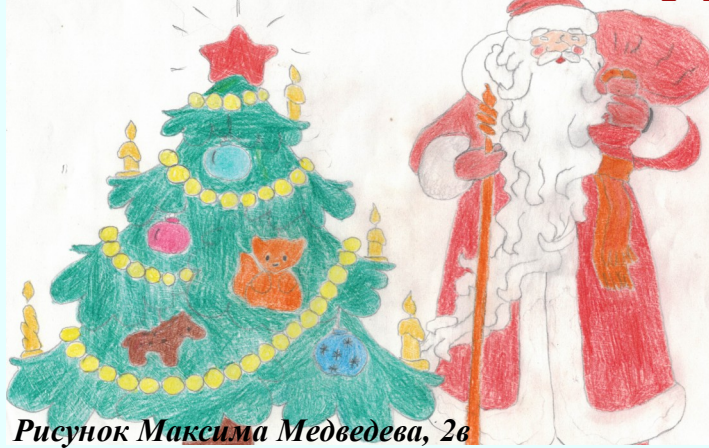
Рисунок Максима Медведева, 2в