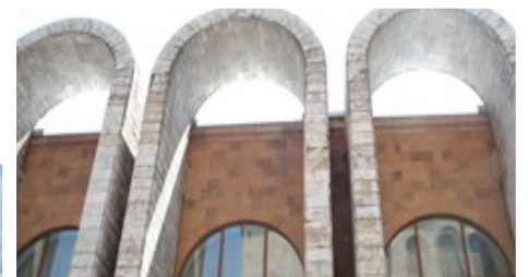
Дом-музей Арама Хачатуряна

Среди природных достопримечательностей страны можно отметить разнообразнейший горный ландшафт (один Арагат чего стоит — туристы и по сей день надеются разглядеть здесь у себя под ногами остатки библейского ковчега) и уникальное озеро Севан (о его прозрачности ходят легенды, а берега украшены интереснейшими рукотворными достопримечательностями разных времён), бесподобные виды и участки по-настоящему нехоженых современным человеком земель.