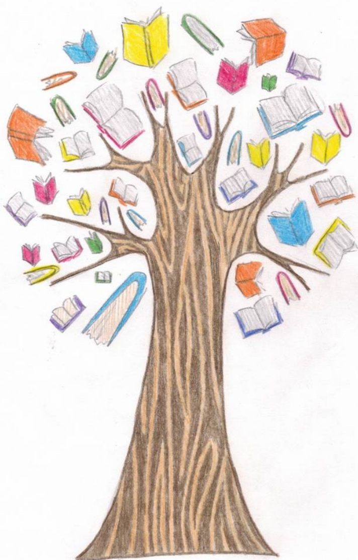
Рисунок Светланы Бажановой, 8Б