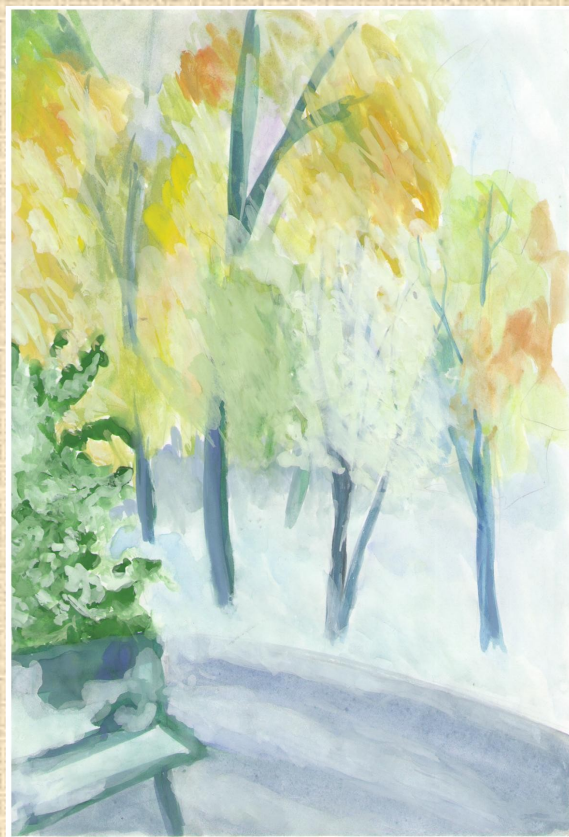
Рисунок Светы Бажановой, 8Б