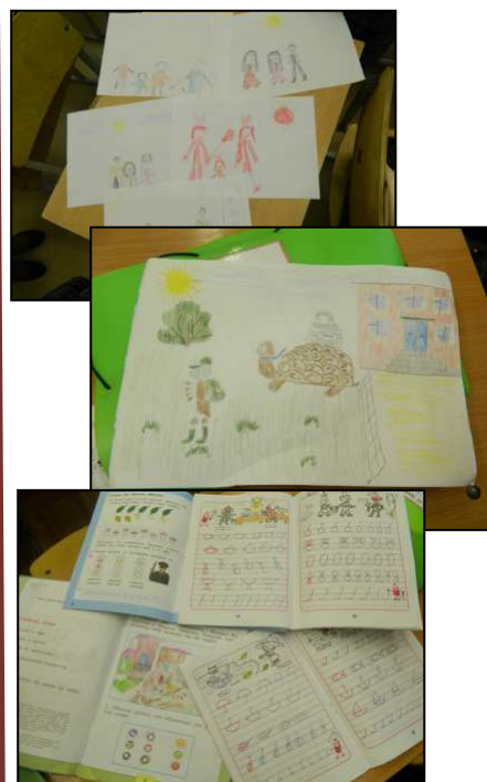
Сорокина Алена, 8 «Б»

Вот и первые рисунки, нарисованные ребятами, и домашние работы, сделанные ими: