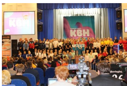
15 декабря состоялся фестиваль школьных команд КВН Нижнего Новгорода