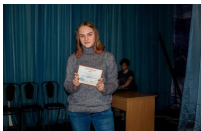
Деловая игра Городской Школы Актива