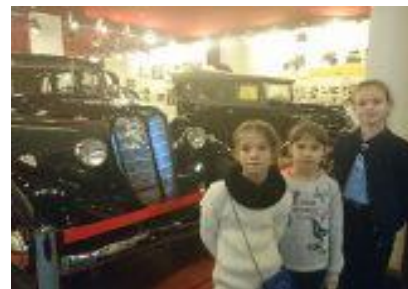
4В класс побывал в музее истории ГАЗ, где узнал об истории завода, познакомился с образцами и особенностями техники, выпускаемой в разные годы