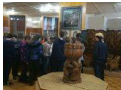
«Живые уроки» в Музее истории Нижегородских промыслов у 7Б класса