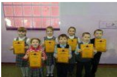
Месячник русского языка в начальной школе