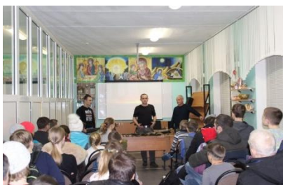
Встреча с представителями военно-патриотического клуба «Щит»