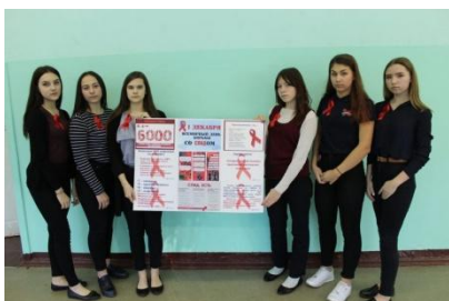
1 декабря – день борьбы со СПИДом. Акция «Красная ленточка»