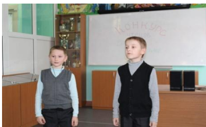
Конкурс чтецов среди ребят 1-4 классов