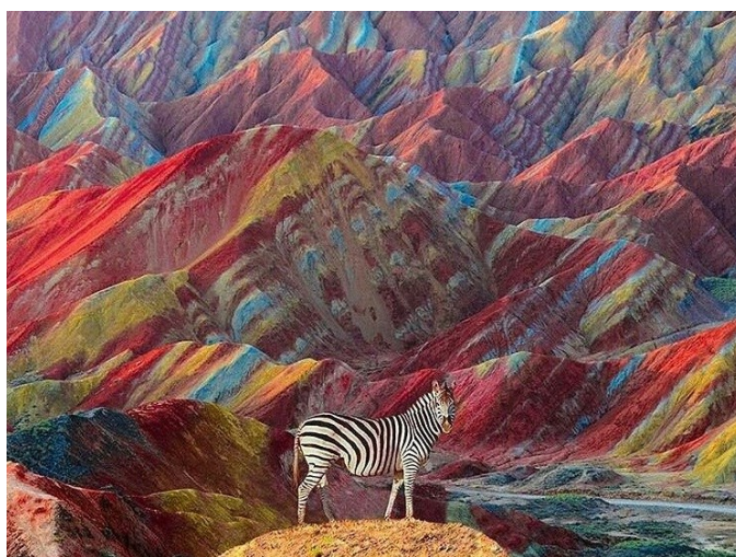
Цветные скалы в Чжанье