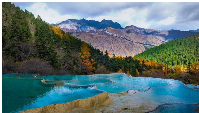
Заповедник в Цзючжайгоу