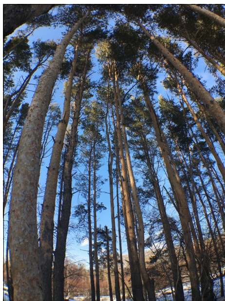
Фото-галерея «Весне дорогу»