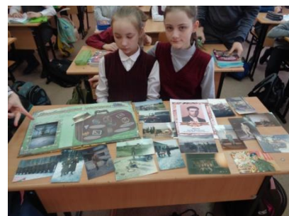
Урок мужества, проведенный с 1-11 класс, посвященный Дню защитника Отечества