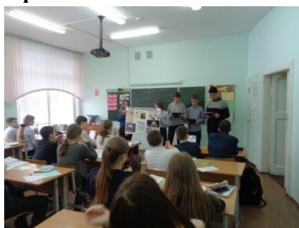
Беседа агитбригады из 9Г с целью профилактики газовой токсикомии (сниффинга)