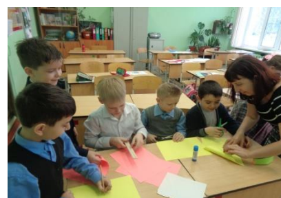
Мастер-класс по изготовлению пилок