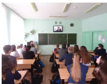
Реализация проекта «Чистая книга» с целью профилактики наркомании, алкоголизма, табакокурения, экстремистских, террористических и др. асоциальных проявлений школьников