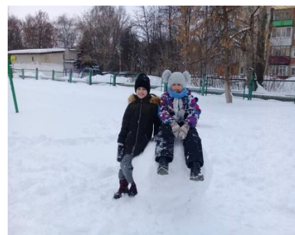
Конкурс снеговиков между группой продленного дня 1 и группой продленного дня 2, посвященный окончанию зимы