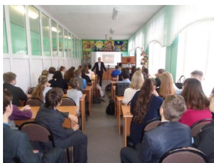
15 февраля – День памяти воина-интернационалиста