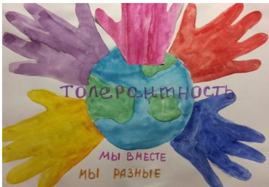
Рисунок Мелковой Наталии, 3 «Б»

«Толерантный человек должен быть внимательным и добрым, уметь общаться с людьми, хорошо излагать свои мысли. Люди отличаются друг от друга национальностью, привычками, одеждой, но живут они вместе и надо уважать молодых и старых, здоровых и больных, бедных и богатых».