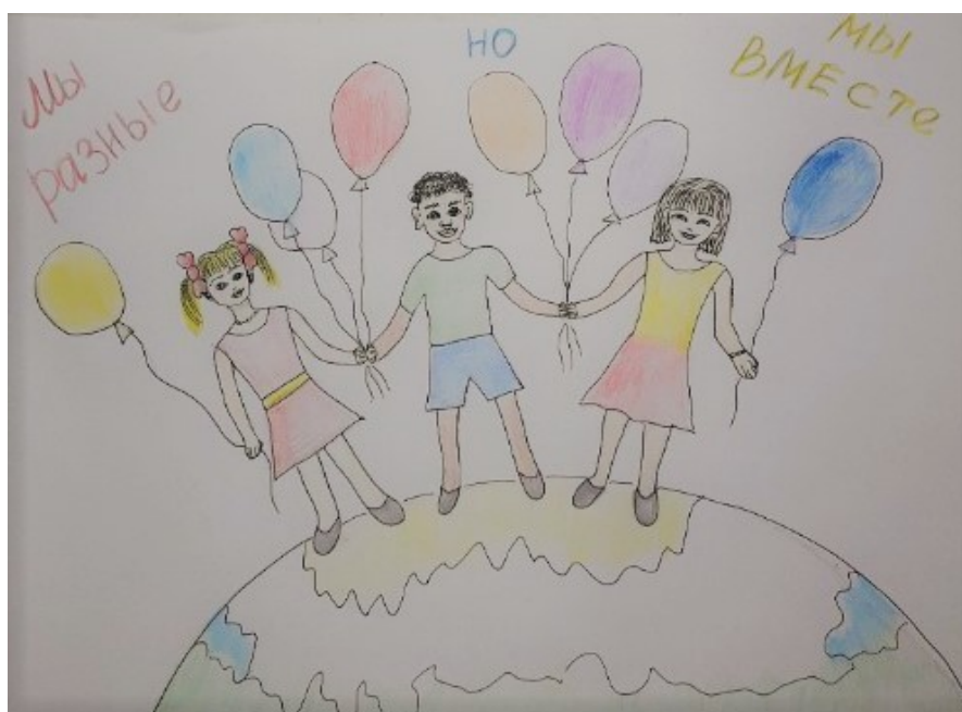
Рисунок Лаптевой Нелли, 3 «В»