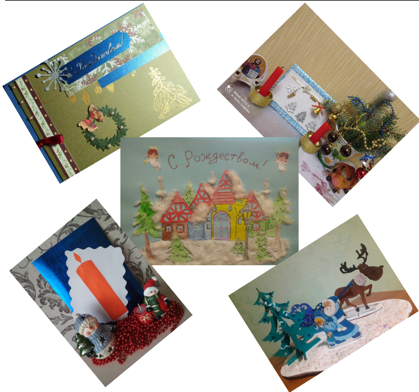
Фото-коллаж «Рождественская открытка»