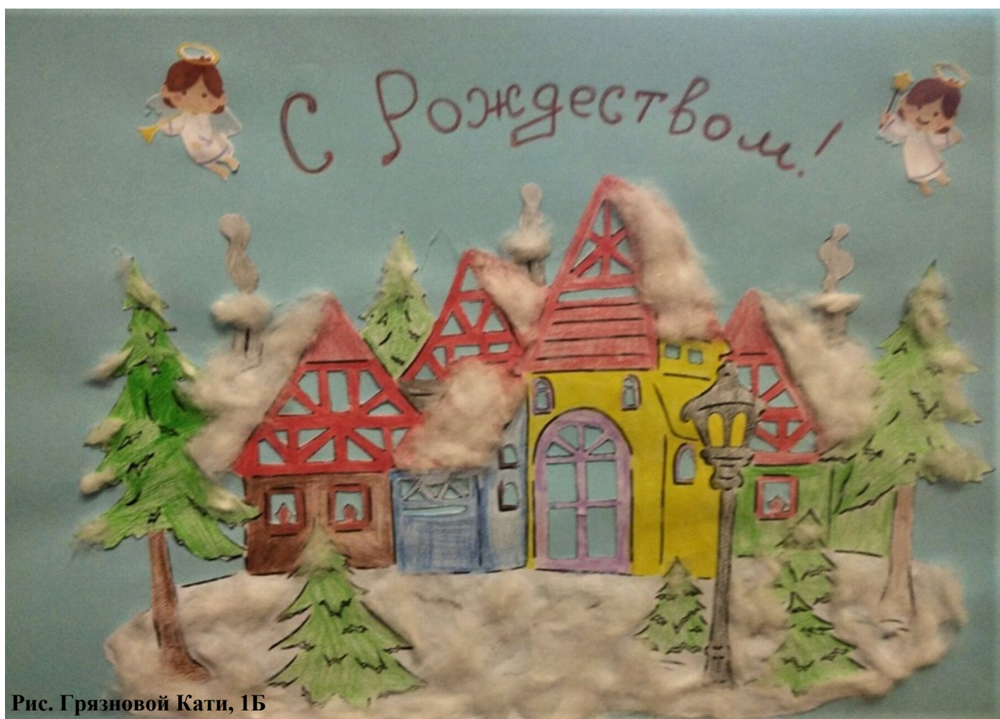
Рис. Грязновой Кати, 1Б